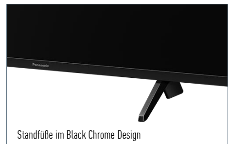
Standfüße im Black Chrome Design